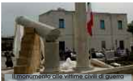
Il monumento alle vittime civili di guerra

Trapani, oggi, si unisce nella commemorazione del settantacinquesimo anniversario del bombardamento del Rione San Pietro, nel corso del quale, sotto gli ordigni degli Alleati, morirono migliaia di civili. Alla fine della guerra le vittime a Trapani saranno 6000 e la città venne insignita della medaglia d'oro al valor civile. In apertura della giornata alle ore 18,30 è prevista la celebrazione eucaristica presso la chiesa San Francesco di Paola. Seguirà alle 19,30 la "fiaccolata della memoria" che ha come punto di ritrovo piazza San Francesco di Paola; il percorso si concluderà con la cerimonia di commemorazione in Via XXX Gennaio, presso il monumento ai caduti civili di guerra. La Giornata della Memoria trapanese è organizzata in collaborazione tra l'Associazione nazionale vittime civili di guerra, l'Associazione «Trapanitradumari&venti», la parrocchia di San Pietro e l'Ente Luglio Musicale trapanese. La giornata della memoria delle vittime civili di guerra il 6 di aprile, giorno del bombardamento più intenso su Trapani, è stata istituita dal sindaco Vito Damiano. (R.T.)