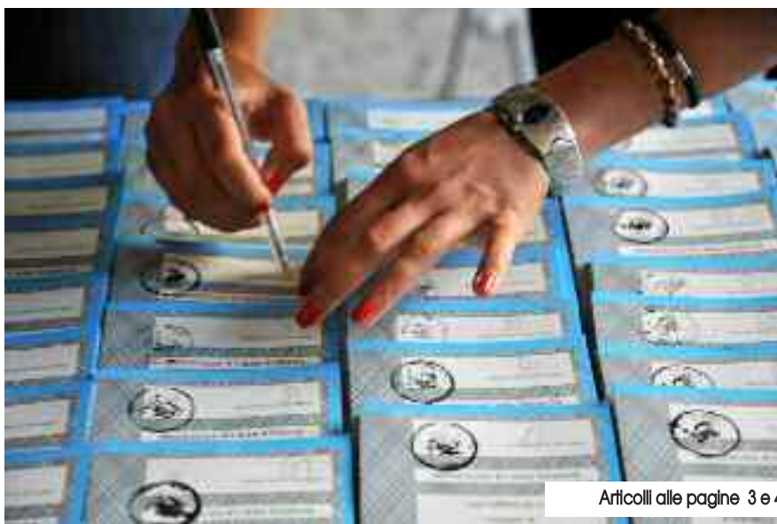
Articoli alle pagine 3 e 4