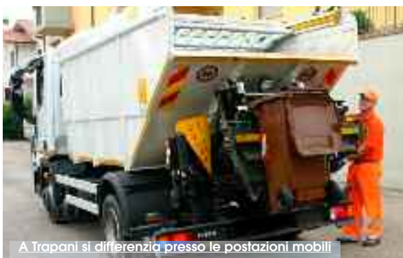
A Trapani si differenzia presso le postazioni mobili

Della raccolta differenziata dei rifiuti a Trapani una cosa s'è capito bene. Chi è chiamato a farla funzionare, insieme ai cittadini trapanesi, è la società Trapani Servizi. Quello che c'è scritto sull'ordinanza commissariale, per quel che riguarda orari e calendari di conferimento, lascia il tempo che trova. Un primo punto fermo la Trapani Servizi lo mette con un comunicato diffuso ieri con il quale si avvisano i trapanesi che «fino a nuova determinazione le frazioni di rifiuto differenziato (carta, cartone, vetro, metalli, plastica), potranno essere conferite oltre che nel Centro Comunale di Raccolta del Lungomare Dante Alighieri, anche nelle postazioni mobili site in Piazza Scalo d'Alaggio e Via Mascagni, secondo il calendario in-